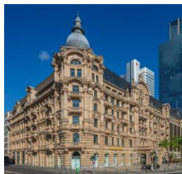
Fürstenhof Frankfurt am Main